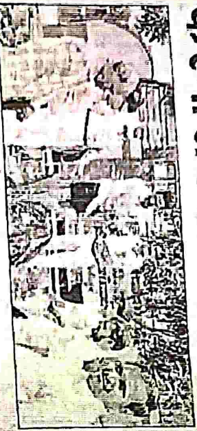
शिक्षण कार्यक्रम में शामिल लोग।

अंतर्राष्ट्रीय पर्यावरण दिवस 5 जून को विश्वभर में मनाया जाता है। संयुक्त राष्ट्र ने विश्व पर्यावरण दिवस मनाना शुरू किया। संयुक्त राष्ट्र पर्यावरण दिवस मनाने का फल 1972 में निकला था। इस पहली बार 1973 में नवीन गंगा या संयुक्त राष्ट्र द्वारा इस दिवस पर्यावरण के लिए विशेष ध्यान को बताना का जन्म था। इस दिवस को 'अंतर्राष्ट्रीय पर्यावरण दिवस' माना जाता है जो एक वैश्विक स्तर पर मनाया जाता है।