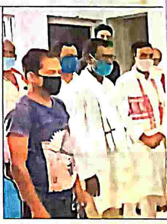
जयंती कार्यक्रम में शामिल भाजपाई.