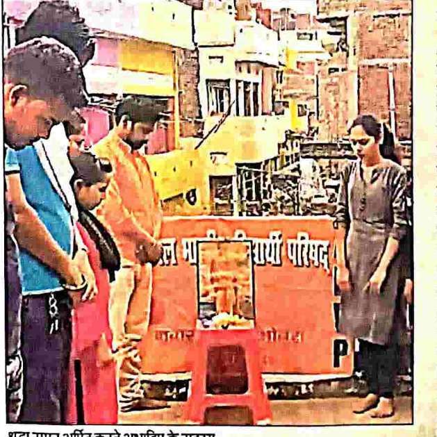
श्रद्धा सुमन अर्पित करते अभाविप के सदस्य.